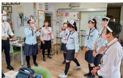
アイスブレイク 私は誰