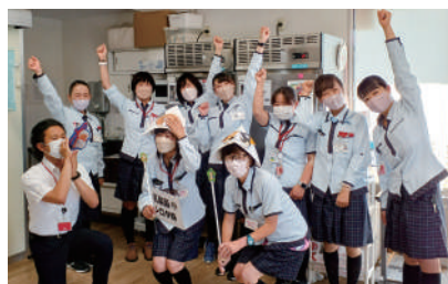
みなかみ夏の合戦