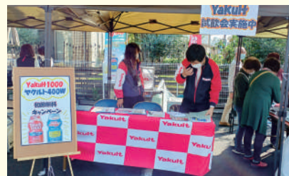
グループホームしょうわ様