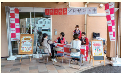
HILLS LADIES CLINIC様