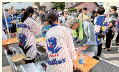
新町ふるさと祭り「神輿まつり」