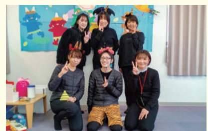
節分イベント開催(平成大橋キッズルーム)