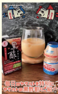
ヤクルトのアレンジを紹介