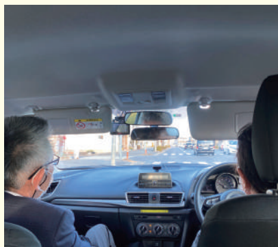
教官による路上での運転診断

今年度初めて、65歳以上のシニア・事故惹起者・管理者を対象に、自動車教習所にて安全運転研修を実施しました。終了後は、委員会内で内容検討・経過を観察して、安全なお届けのための運転技術向上に努めます。