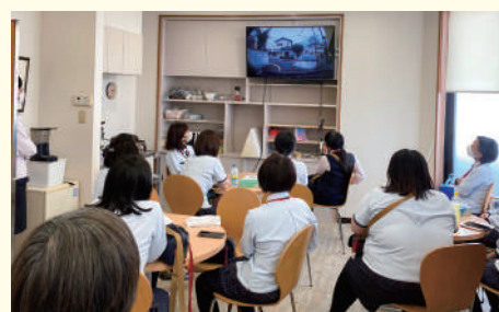
各サービスセンターにて動画視聴

5月の全国春の交通安全運動に合わせて、第10回交通安全研修会を実施しました。社内で実際に起きた事故時のドライブレコーダーの映像を編集して、動画を作成し、全従事者へ前方注意の啓発を行いました。動画の視聴後、アンケートを実施したところ、「運転に集中する」と答えた方が多く、安全運転への啓発に繋がりました。