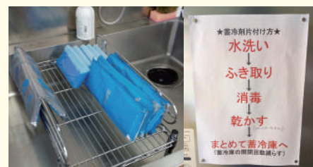
蓄冷剤の片付け方の標準化(中之条SC・高崎北SC)