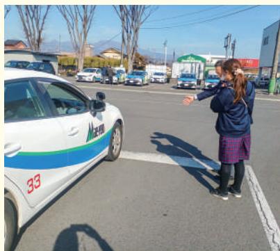
実際の事故内容による実車訓練