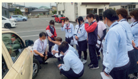
点検表を基にグループに分かれて点検(タイヤの溝を確認)

9月の全国秋の交通安全運動に合わせて、第3回安全お届け推進活動を行いました。3年目となる今年度は、前橋中央SC・高崎西SC・高崎東SC・松井田SCの4か所で実施しました。この活動は車両の内外装をきれいに保つことで、運転に集中できる環境を作ることを目的に、委員会メンバーと一緒に内外装の点検を行っています。