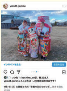
前橋市はたちのつとよいフォトスポット