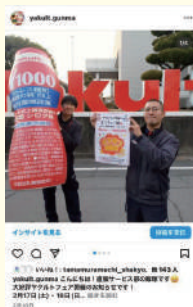
大好評ヤクルトフェア