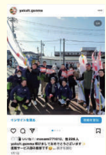
みんなでニューイヤー駅伝応援