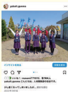
新人ヤクルトスタッフ紹介シリーズ